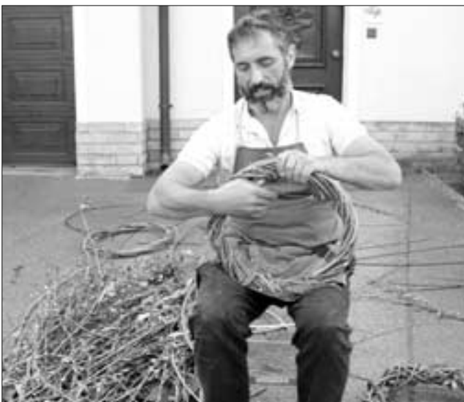
Aus rohen Weidenruten wurden rustikale Kränze gewunden.