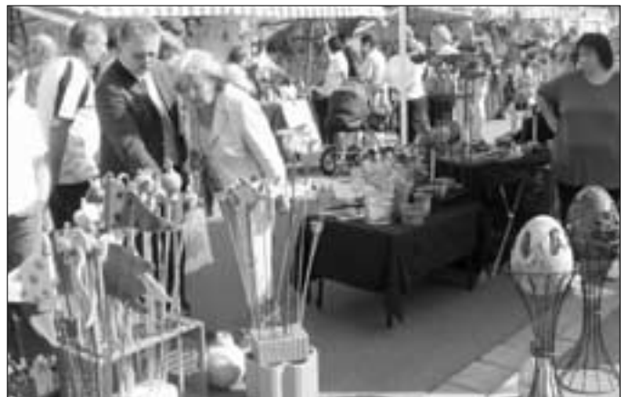
Töpferwaren in vielfältigster Form waren ein Beispiel der Produktpalette des bestens besuchten Küpser Kunsthandwerkermarktes.