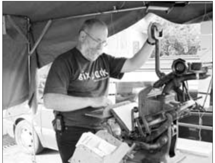
Bierfilze mit individuellem Aufdruck entstanden mit einer alten Handpresse.