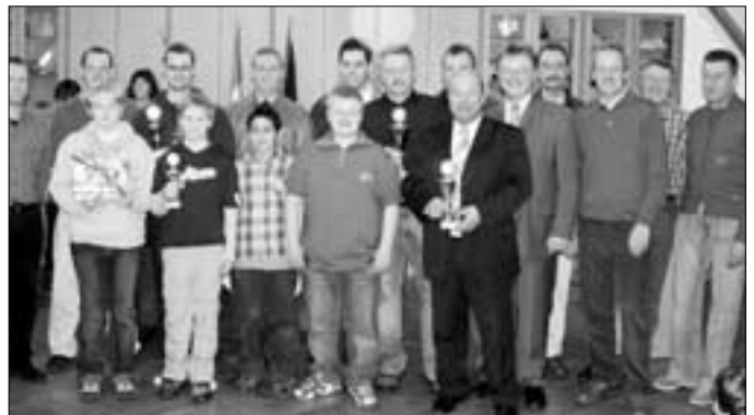
Mit den Herren des Tennisclubs Küps, den Faustballer aus Schmözl und den Tischtennisfreunden vom TTC-Küps 1992 e.V. konnten weitere erfolgreiche Sportler geehrt werden.