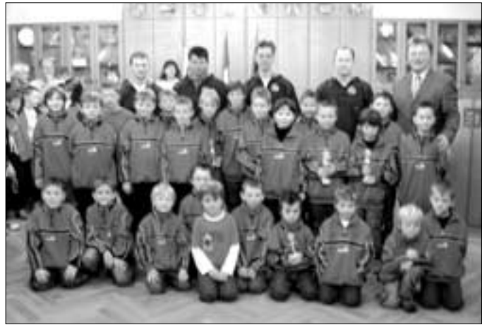
Der Fußballnachwuchs in TSV-Theisenort mit den F1, F2, E und G-Junioren konnte stolz auf seine Leistungen sein.