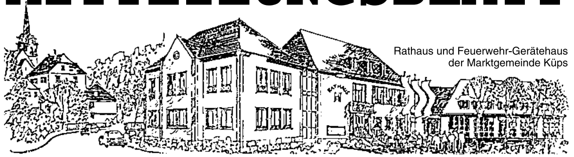
Rathaus und Feuerwehr-Gerätehaus der Marktgemeinde Küps

MIT SEINEN GEMEINDETEILEN: AU, BURKERSDORF, HAIN, JOHANNISTHAL, KÜPS, OBERLANGENSTADT, SCHMÖLZ, THEISENORT und TÜSCHNITZ