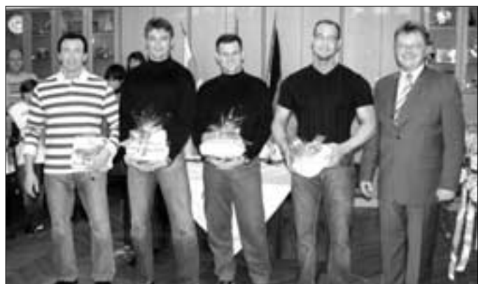
Auf internationalem Parkett bewegen sich die Bodybuilder vom Küpser Fitness-Studio GYM 80 souverän und ausgesprochen siegreich.