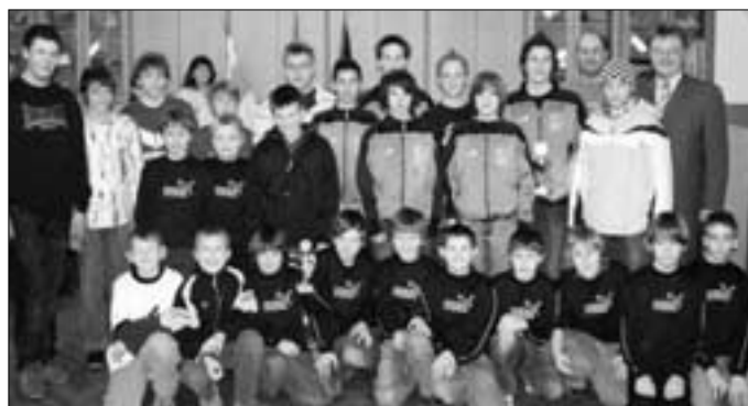
Vom SSV Ober-/Unterlangenstadt freuten sich die Jugendmannschaften D, E und F über ihre Erfolge und auch die Jugend im VfR-Johannisthal erbrachte erfreuliche Leistungen.

Unsere Bilder zeigen die erfolgreichen Küpser Sportlerinnen und Sportler: