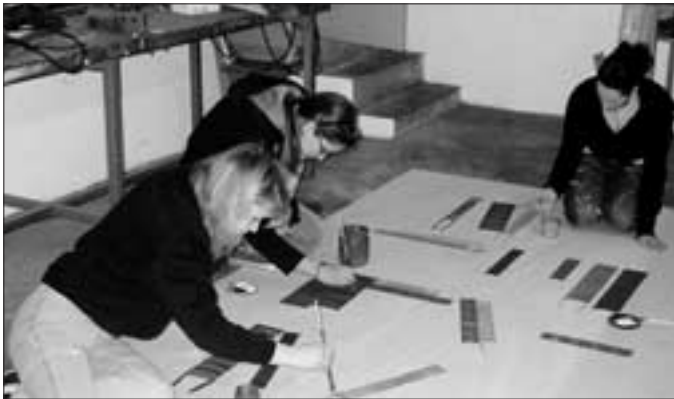
Für die entsprechende Kulisse sorgen eifrig die künstlerisch begabten Malerinnen des Orchesters.