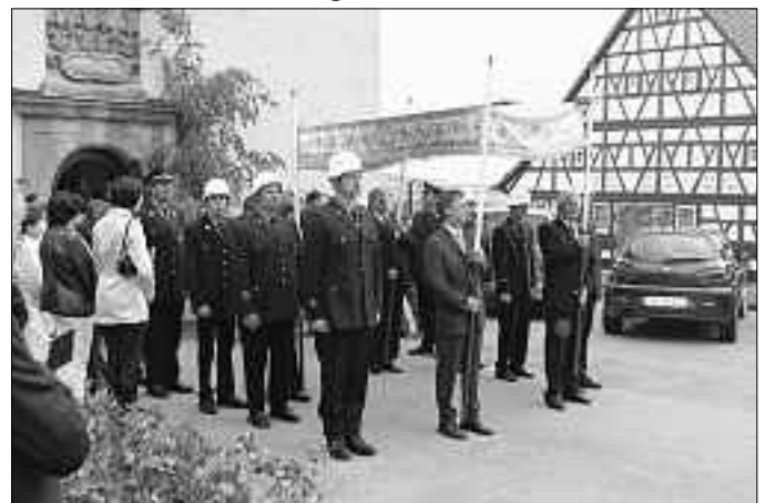
Die Männer der FFW Theisenort bildeten dem Allerheiligsten Spalier am "Himmel"