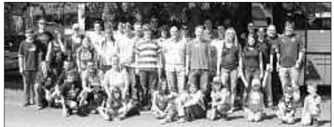
Ein Teil der TSV-Aktiven vor dem Vergnügungspark Geiselwind

Nach dem offiziellen Teil wurde bis in die frühen Morgenstunden gefeiert, indem spontane Gesangseinlagen zum Besten gegeben wurden oder gemeinsam bekannte Lieder gesungen wurden. Bilder der Veranstaltung sowie die Vereinshymne sind auf der Homepage www.tsv-kueps.de zu finden.