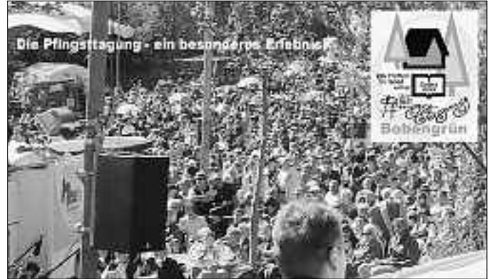
Bild von der Pfingsttagung 2009