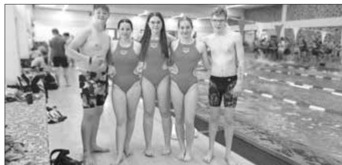
Unser Bild zeigt die erfolgreiche Mannschaft All4One während des Wettkampfs im MAKBAD Marktredwitz.

Alle Teilnehmer freuten sich über den gut strukturierten Ablauf des Schwimmwettkampfs und schauern zuversichtlich den Bayerischen Meisterschaften im Rettungsschwimmen entgegen, die dieses Jahr Ende Juni in Dillingen stattfinden werden.