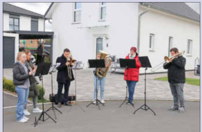
Ein Ensemble des Symphonischen Blasorchesters Küps. Vielen Dank für die musikalische Umrahmung.