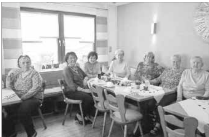
Die Senioren waren von der Muttertagsfeier angetan.