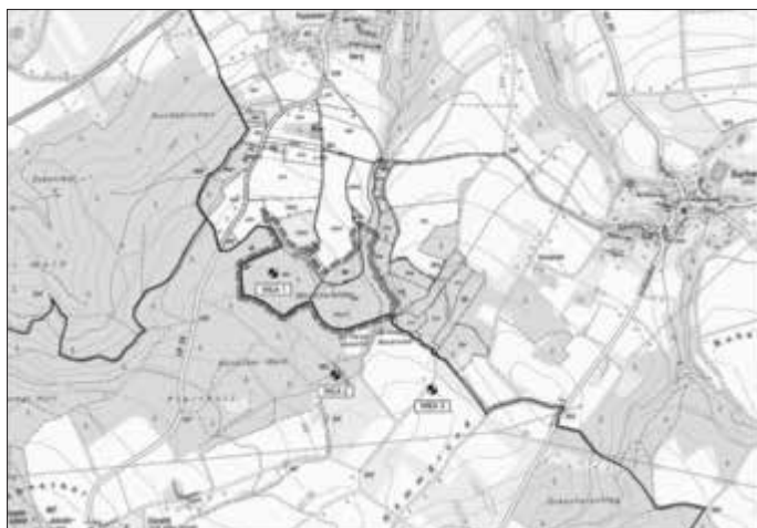
Abb. 1: Lageplan des Bebauungsplans „Windpark Burgkunstadt-Küps Sondergebiet Küps“, ohne Maßstab