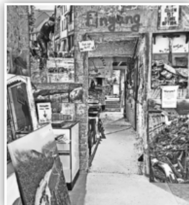
... die außer vielen Bildern auch mehrere Filmsequenzen beinhaltet.

AHRTAL. AFi. Auch fast zwei Jahre nach der verheerenden Flut ist das Ausmaß der Schäden entlang der Ahr weiterhin gegenwärtig. An vielen Stellen sieht es auf den ersten Blick noch immer nicht danach aus – doch es geht voran. Inhaber von Hotels, Restaurants und Geschäften haben, samt ihrer Mitarbeiter*innen, unzählige Stunden Arbeit, verbunden mit viel Hoffnung und Mut, in den Wiederaufbau ihrer geschäftlichen Existenzen gesteckt. Das Ziel: Endlich wieder zahlreiche Tages- und Übernachtungsgäste sowie Kundinnen und Kunden begrüßen zu können. Wanderfreudige Besucher*innen des Ahrtales dürfen sich, neben unvergesslichen Stunden in grandioser Natur entlang