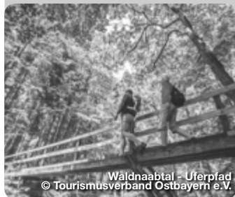
Waldnaabtal - Uferpfad

TreffpunktDeutschland.de/oberpfaelzer-wald