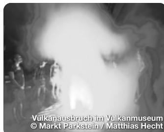
Vulkanausbruch im Vulkanmuseum

einen Blick in die romantisch verwinkelten Gässchen zu werfen, denn auch hier finden sich schmucke Boutiquen und viele Cafés. Besonders Kulturinteressierte sind beeindruckt von der wechsellvollen Geschichte der evangelischen Stadtpfarrkirche Sankt Michael und der Josefskirche. TreffpunktDeutschland.de/weiden