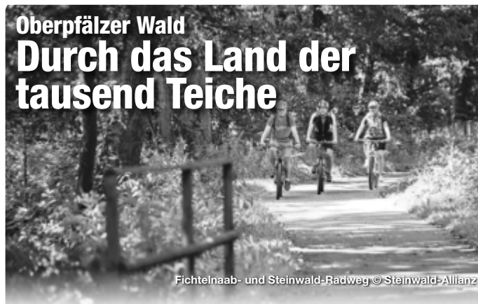
Fichtelnaab- und Steinwald-Radweg

Steinwald-Radweg. An einem Tag einen ganzen Naturpark auf dem Fahrrad umrunden? Das klingt verlockend und ist im Naturpark Steinwald auch tatsächlich möglich. Die 60 Kilometer lange Tour eignet sich für sportliche Radfahrer und E-Biker. Den Startpunkt wählt man nach Belieben. Der Rundkurs führt vorbei an Schlössern und bedeutenden Kirchenbauten wie der barocken Wallfahrtskirche Maria Hilf in Fuchsmühl. Ein weiteres Highlight ist die Teichpfanne von Wiesau, Teil einer Jahrtausende alten Kulturlandschaft mit über 4.000 Teichen, in denen die Tradition der Fischzucht bis heute kultiviert wird. Bei Friedenfels schlängelt sich der Steinwald-Radweg vorbei am idyllisch gelegenen Haferdeckfelsen mit Weiher. Bei Neusorg mündet der Weg in den Fichtelnaab-Radweg, der von Bischofsgrün kommend nach Windischeschenbach führt. Der schönste Teil der Runde führt auf kurvigen, schmalen Wegen durch das Tal der Fichtelnaab, dem westlichen Quellfluss der Waldnaab. Ein weiterer Blickfang ist das Schloss in Reuth bei Erbdorf, das sich heute in Privatbesitz der Familie von Podewils befindet und eine Brauerei beherbergt. Wer auf dem Steinwald-Radweg unterwegs ist, sollte unbedingt die Gelegenheit nutzen und den Zoigl, eine regionale Bierspezialität, kosten. TreffpunktDeutschland.de/oberpfaelzer-wald