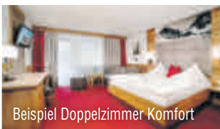
Beispiel Doppelzimmer Komfort